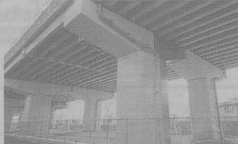
桑原組—国道161号坂本高架橋橋梁補修工事