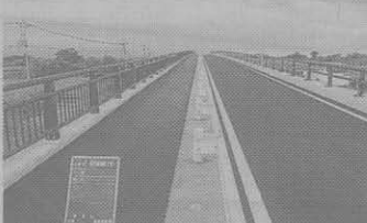
鹿島道路—姉川橋舗装工事