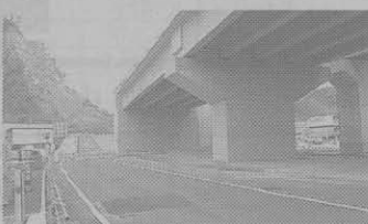
桑原組—粟東水口道路石部南高架橋橋台他工事