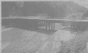
桑原組—大津信楽線工事用進入路整備工事、大津信楽線工事用進入路整備(その2)工事