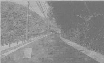
長村組—山王仙郷谷線道路拡幅工事