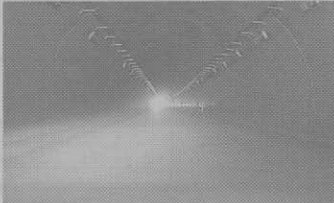
桑原組—丹波綾部道路院内地区他舗装工事