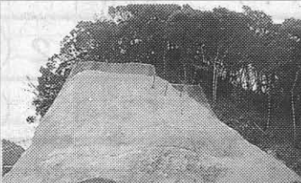
古瀬組—天ヶ瀬ダム再開発トンネル放流設備吐口周辺整備工事