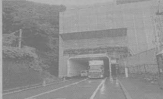
桑原組—賤ヶ岳トンネル換気所撤去その他工事